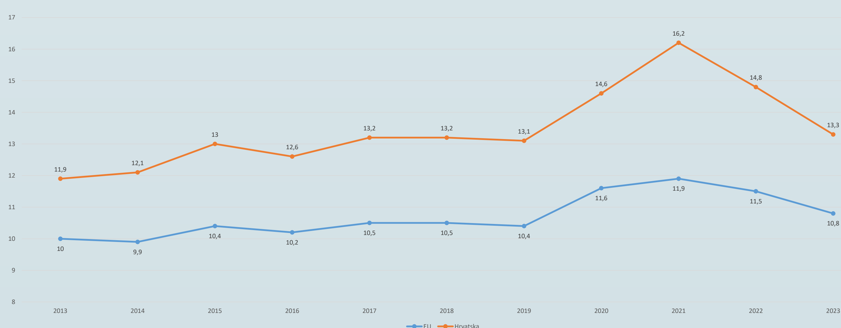
Slika 1. Kretanje opće stope mortaliteta u Republici Hrvatskoj i Europskoj uniji od 2013. do 2023. godine

Opća stopa mortaliteta u EU pokazuje relativno stabilne trendove tijekom analiziranog razdoblja, s manjim varijacijama iz godine u godinu. To ukazuje na općenito dobro zdravstveno stanje i učinkovite zdravstvene sustave u većini zemalja članica EU. U Hrvatskoj je vidljiv blagi pad opće stope mortaliteta sve do 2019. godine, no nakon toga dolazi do značajnog porasta opće stope mortaliteta u Hrvatskoj tijekom razdoblja pandemije COVID-19. Hrvatska je, nažalost, s obzirom na podmakli stupanj ostarjelosti i prosječne vrijednosti općega mortaliteta od 2015. godine, rangirana među deset država s najvećom COVID-19 smrtnosti u odnosu na njezinu ukupnu populaciju (Komušanac i Mažar, 2024). Tijekom cijelog analiziranog razdoblja, opća stopa mortaliteta u Hrvatskoj bila je nešto viša u usporedbi s prosjekom EU.